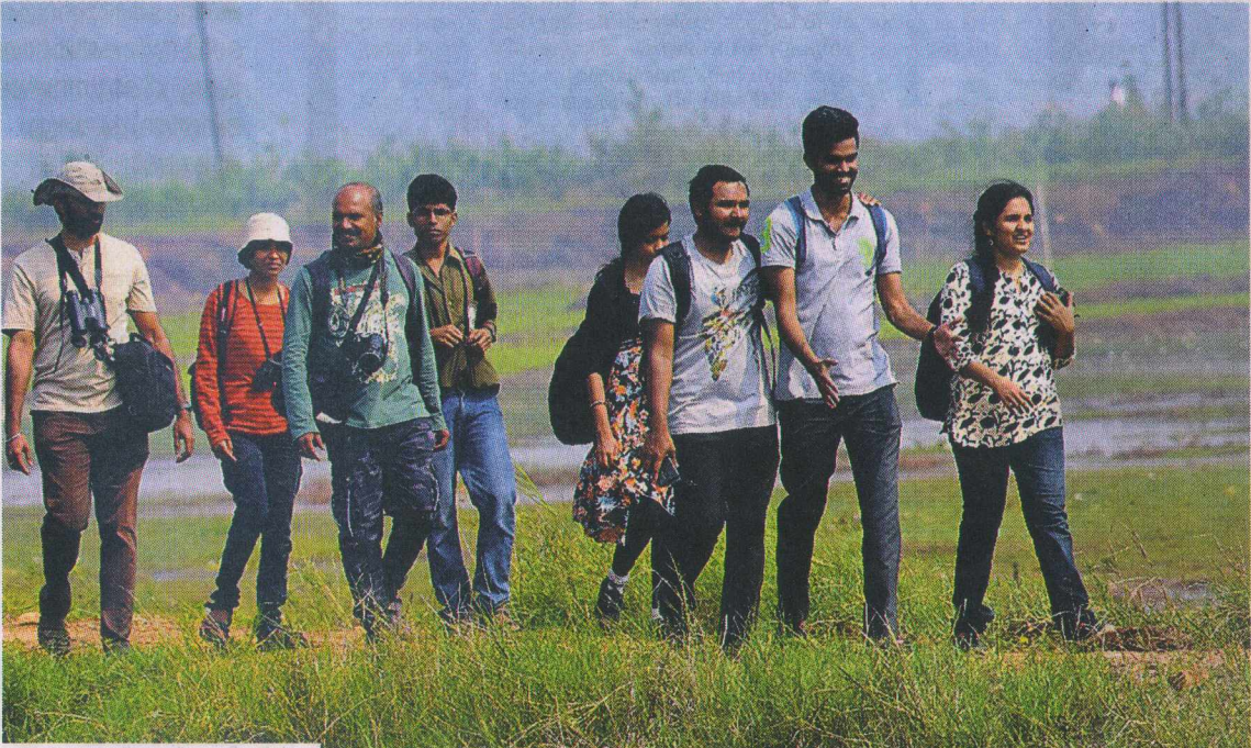
കോരപ്പാടങ്ങളിൽ സർവ്വേ നടത്താനിറങ്ങിയവർ

48,312 പക്ഷികളെയാണ് കണ്ടെത്തിയത്. 18,507 പക്ഷികളുടെ എണ്ണം കുറവാണ് ഇക്കൂറി. താരാവുകളുടെ ഇനത്തിൽ പെട്ട എറണ്ട, നിർകാക്ക, മുണ്ടി (വെള്ള