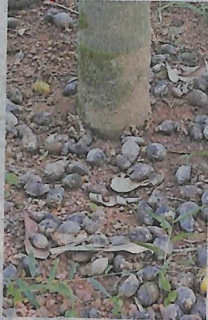
മഹാളിരോഗം ബാധിച്ചു കൊഴിഞ്ഞു വീണ അടയ്ക്കകൾ.

പെരുമ്പിലാവ് • കടവല്ലൂർ, കാട്ടുകാമ്പാൽ പഞ്ചായത്തുകളിലെ കവുങ്ങിൻ തോട്ടങ്ങളിൽ മഹാളിരോഗം പടരുന്നു. ഓഗസ്റ്റ് ആദ്യവാരത്തിൽ തളിച്ച മരുന്ന് മഴയിൽ ഒലിച്ചുപോയതാണു കാരണം.