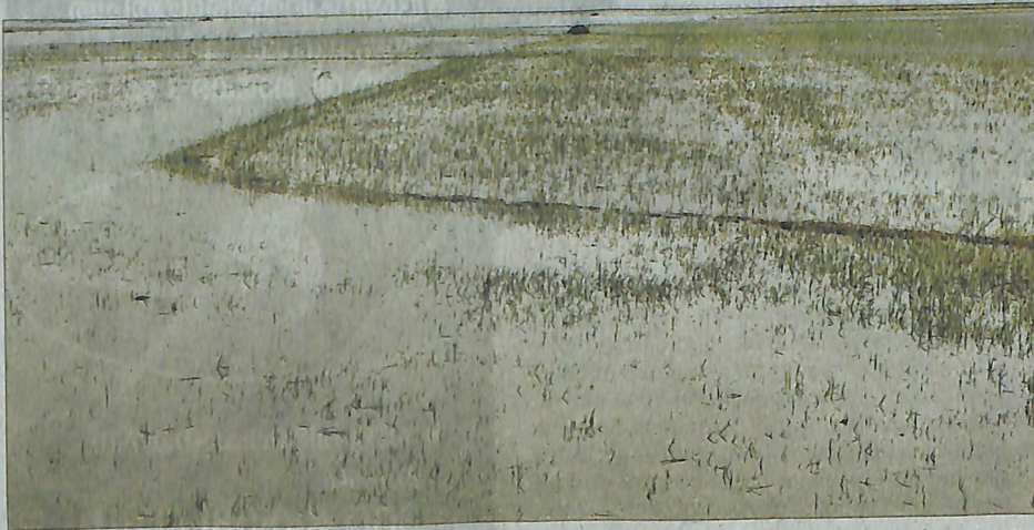
പറപ്പൂർ സഹകരണസംഘത്തിനുകിഴിത് വരുന്ന നോർത്ത് കോൾഷടവിൽ പട്ടാളപ്പുഴുശല്യം വ്യാപകമായിത്തീർന്നു വെള്ളം നിറച്ചിട്ടിരിക്കുന്നു

തൊണ്ണൂറുദിവസംകൊണ്ട് മൂപ്പെത്തി കൊയ്യാൻ പാകമാകുന്ന അനുഗ്രി വിത്താണ് വിതച്ചത്. നെൽച്ചെടിയുടെ കടമുതൽ ഇലവരെ പൂർണ്ണമായും പൂഴുക്കെത്തി നൂന്നുണ്ട്. ദിനപ്രതി പട്ടാളപ്പുഴുക്കളുടെ എണ്ണം വർധിക്കുന്നതിനാൽ പ്രതിക്ഷിപ്ത വിളവുലഭിക്കുമോ എന്ന ആശങ്കയിലാണ് കൃഷിയിറക്കിയ 150 കർഷകർ. ആദ്യമാ